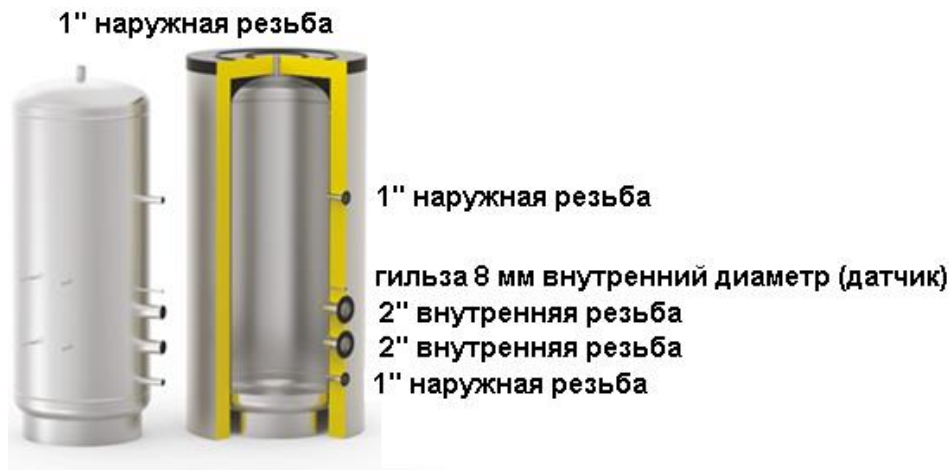
Схема бака серии SS ELECTRO